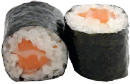
J61. Maki Saumon (8 pcs.) 8.00€