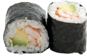
J63. Maki Crevette Avocat (8 pcs.) 8.10€