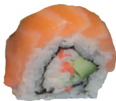
J12. Caterpillar Roll (8 pcs.) (Smoked Salmon/Surimi/A- vocat) 9.50€