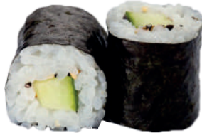
J37. Maki Kappa (Con- combre) (8 pcs.) 6.60€