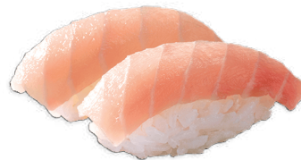
J27. Nigiri Tilapia (2 pcs.) 3.80€