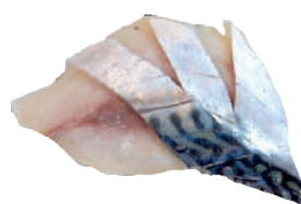
J47. Sashimi Saba (5 pcs.) 5.20€