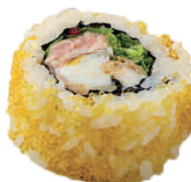
J13. Spider Roll (8 pcs.) (Tempura Scampi et Avocat) 9.50€