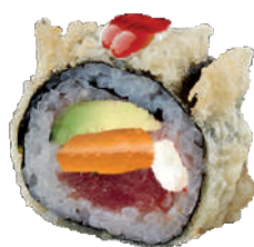
J20. Dynamic Roll 🌶️ 🌶️ (8 pcs.) (Fromage/Saumon/- Thon/Avocat) 15.50€