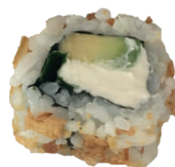
J68. Maki Printemps (8 pcs.) (Fromage/Avocat/Feuille de Menthe/Oignon frits) 8.50€