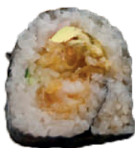
J19. Tempura Roll (8 pcs.) (Fromage/Tempura Scampi/Saumon) 12.50€