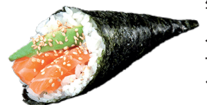
J69. Temaki Saumon et Avocat (1 pièce) 4.00€