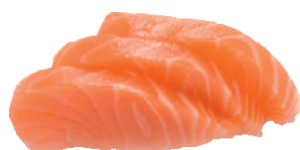
J32. Sashimi Saumon (5 pcs.) 5.20€