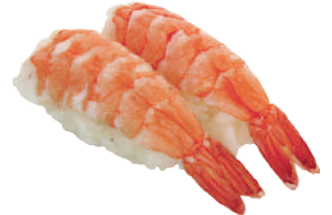
J24. Nigiri Ebi (2 pcs.) 4.00€