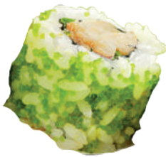
J16. Broce Roll (8 pcs.) (Scampi et Avocat) 9.00€