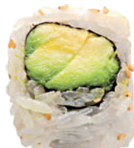
J67. Philadelphia Avocat Roll (8 pcs.) (Fromage/Avocat) 8.00€