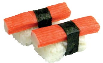
J28. Nigiri Kani (2 pcs.) 3.50€