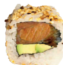
J14. New York Roll (8 pcs.) (Saumon frits et Avocat) 8.50€