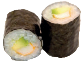
J64. Maki Surimi Avocat (8 pcs.) 8.10€