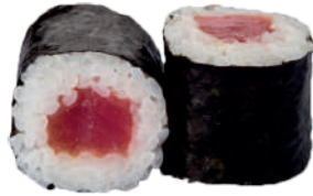
J62. Maki Thon (8 pcs.) 8.10€