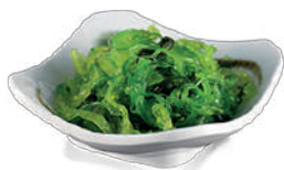
J02. Goma Wakame (Salade d'algues) 4.85€