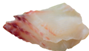
J33. Sashimi Tilapia (5 pcs.) 5.20€