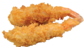
J01. Tempura Scampi (7 pcs.) 9.75€