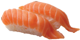
J21. Nigiri Sake (2 pcs.) 3.80€