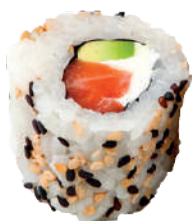
J15. Philadelphia Roll (8 pcs.) (Fromage/Thon/Sau- mon) 9.00€