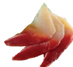
J66. Sashimi Hokkigai (6 pcs.) 6.20€