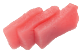
J31. Sashimi Thon (5 pcs.) 6.20€