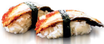
J25. Nigiri Unagi (2 pcs.) 5.20€