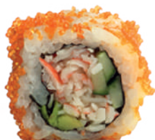
J11. California Roll (8 pcs.) (Surimi et Avocat) 8.50€