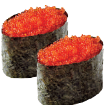
J29. Nigiri Ikura (2 pcs.) 4.00€