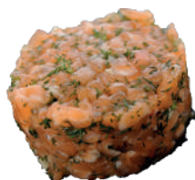
J30. Tartare Saumon et Thon au Sauce Soja Sucrée 8.00€