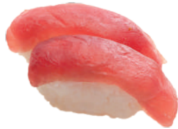
J22. Nigiri Maguro (2 pcs.) 4.20€