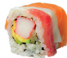
J18. Rainbow Roll (8 pcs.) (Saumon/Thon/A- vocat/Surimi) 10.50€