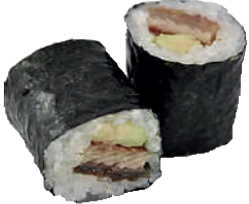
J65. Maki Unagi Avocat (8 pcs.) 8.50€