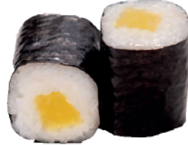
J38. Maki Radis (8 pcs.) 6.60€