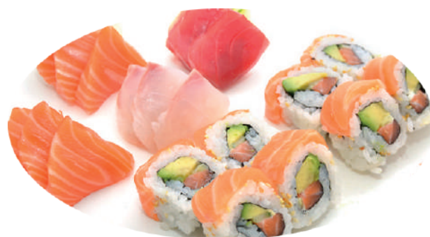
J81. Plateaux Sushi Express (8 pcs. Maki et 12 pcs. Sashimi)