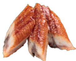
J35. Sashimi Eel (5 pcs.) 6.20€