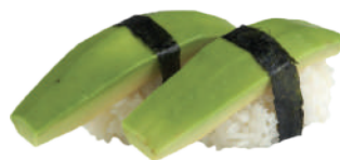
J40. Nigiri Avocat (2 pcs.) 4.00€