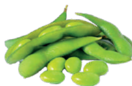
J03. Edamame 4.85€