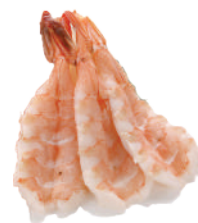
J34. Sashimi Ebi (5 pcs.) 5.00€