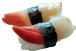
J26. Nigiri Hokkigai (2 pcs.) 4.20€