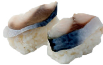
J23. Nigiri Saba (2 pcs.) 3.80€