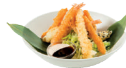
J04. Tempura (Scampi/Légumes frits) 14.50€