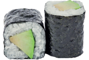
J39. Maki Avocat (8 pcs.) 6.90€