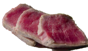
J36. Sashimi Thon Grillé (10 pcs.) 14.80€