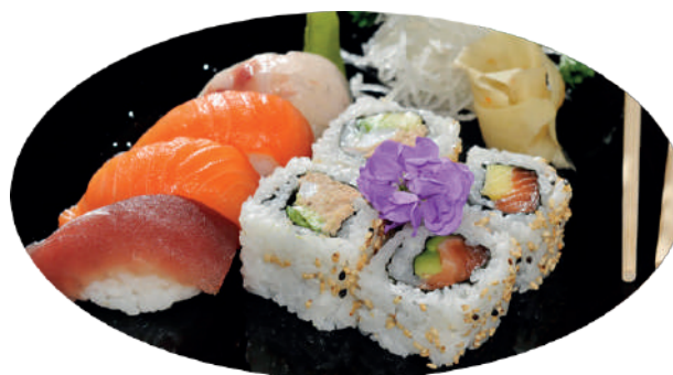
J80. Entrée Sushi (4 pcs. Maki et 3 pcs. Nigiri)